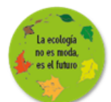
Claudia Engeler Directora

¡Nos deseo a todos unos agradables últimos días de colegio y pronto, unas fantásticas vacaciones de invierno!