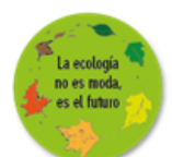
Claudia Engeler Directora

Uns wünsche ich einen bewussteren Umgang mit dem Element Wasser und einen regenreichen Winter!